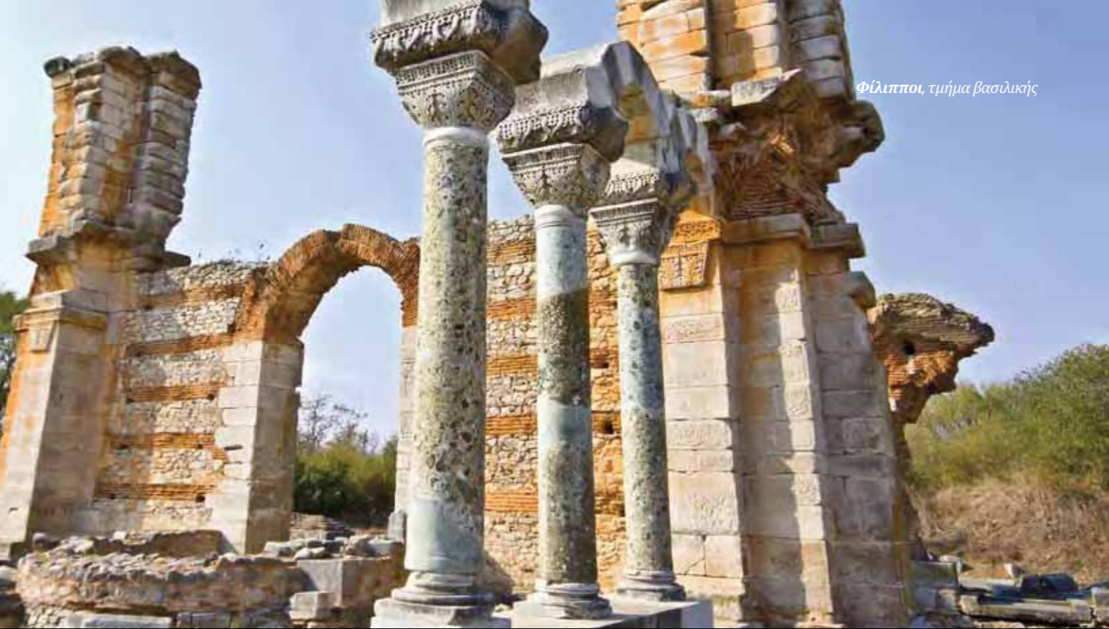
Φίλιπποι, τμήμα βασιλικής