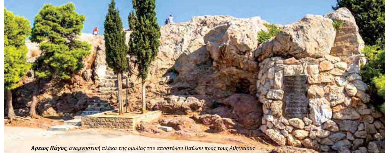
Άρειος Πάγος, αναμνηστική πλάκα της ομιλίας του αποστόλου Παύλου προς τους Αθηναίους