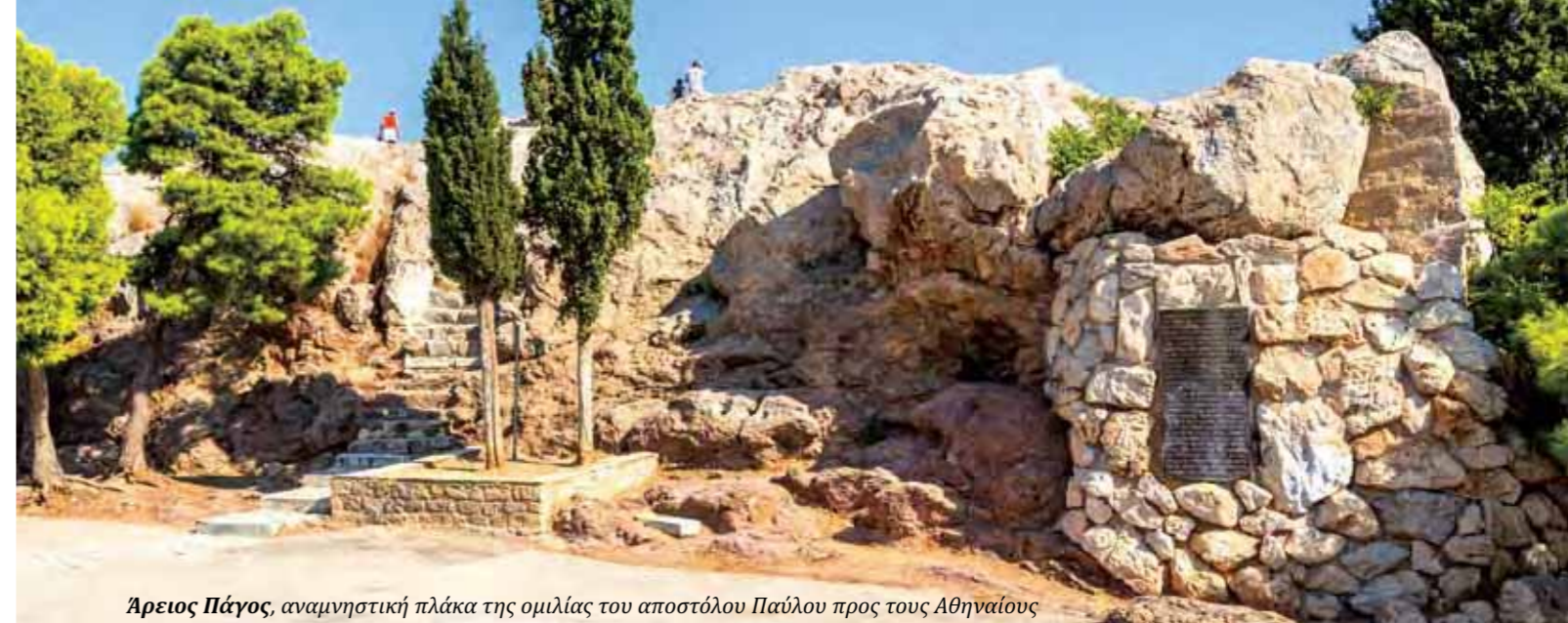
Άρειος Πάγος, αναμνηστική πλάκα της ομιλίας του αποστόλου Παύλου προς τους Αθηναίους