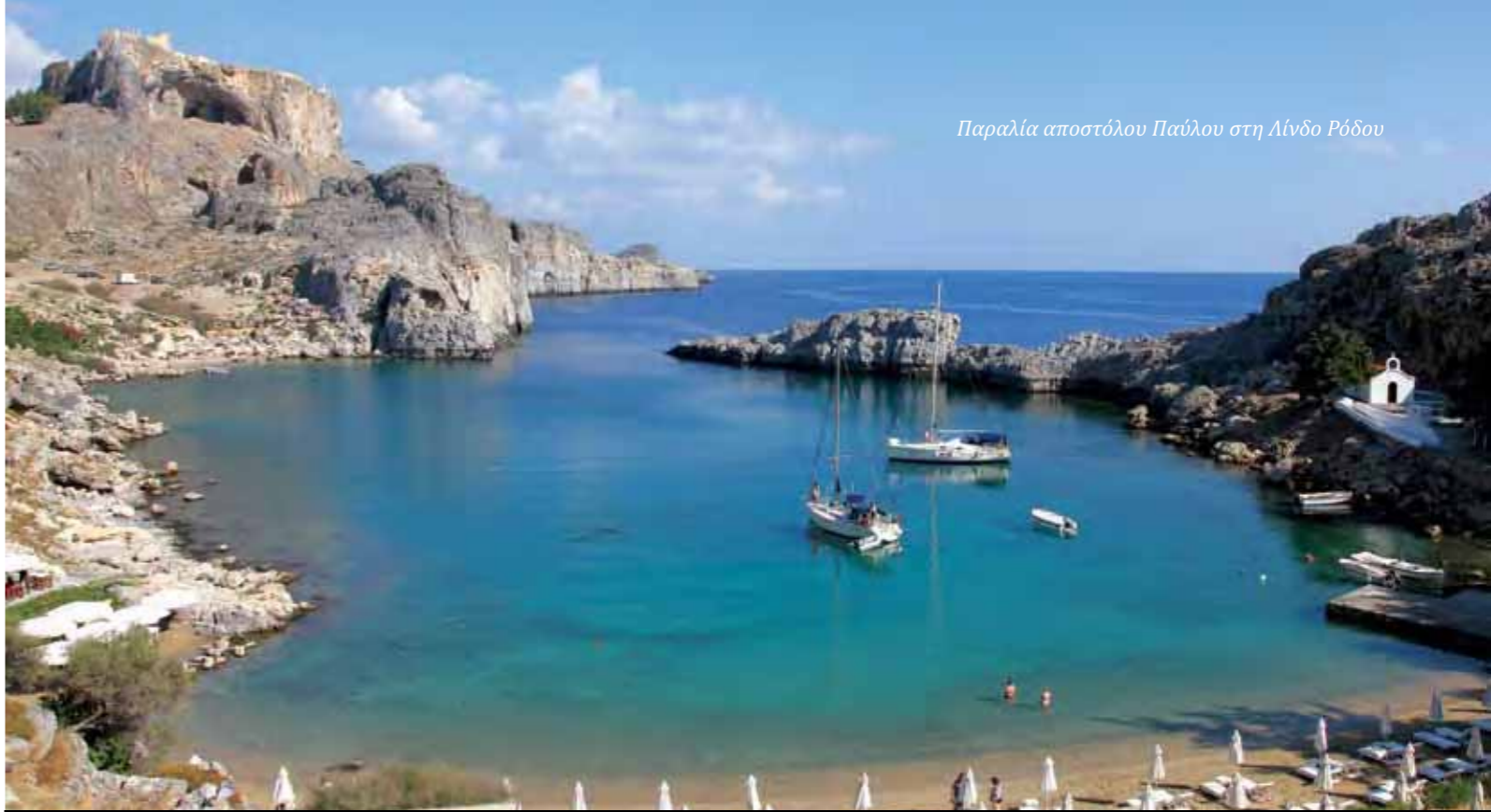
Παραλία αποστόλου Παύλου στη Λίνδο Ρόδου

Τέλος, ένα ιδιαίτερα σημαντικό εύρημα στον αρχαιολογικό χώρο της Κορίνθου είναι μια λατινική επιγραφή που εντοπίστηκε στη μικρή πλατεία ανατολικά του θεάτρου και χρονολογείται στο α΄ μισό του 1ου αιώνα μ.Χ. Η επιγραφή αυτή τοποθετήθηκε εκεί προς τιμήν κάποιου Έραστου, οικονόμου της πόλης της Κορίνθου, ο οποίος χρηματοδότησε την πλακόστρωση της πλατείας ως ανταπόδοση για την τοποθέτησή του στη θέση αυτή. Η σημασία του ευρήματος αυτού έγκειται στο γεγονός ότι πρόκειται προφανώς για τον ίδιο Έραστο που μνημονεύεται στην προς Ρωμαίους επιστολή (16,23) ως οικονόμος της πόλης της Κορίνθου, πιθανώς δε και για τον Έραστο που αναφέρεται και αλλού στην Καινή Διαθήκη (Πράξ. 19,22 και Β΄ Τιμ. 4,20) δεδομένης της σπανιότητας του ονόματος και της συσχέτισής του και πάλι με τον Παύλο και την πόλη της Κορίνθου. Αντίστοιχης σημασίας εύρημα, αν και όχι από τον αρχαιολογικό χώρο της Κορίνθου, αλλά των Δελφών, είναι και η λεγόμενη επιγραφή του Γαλλίωνος , η οποία αποτελεί την αρχαιολογική τεκμηρίωση της αναφοράς του Παύλου στον ομώνυμο ρωμαίο ανθύπατο, κατά την πρώτη επίσκεψή του στην Κόρινθο.